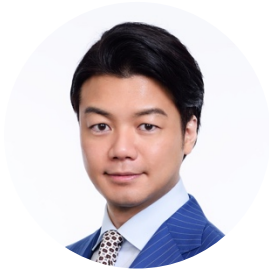
創業者 元代表取締役会長 弁護士