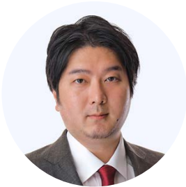
取締役 クラウドサイン事業責任者 弁護士